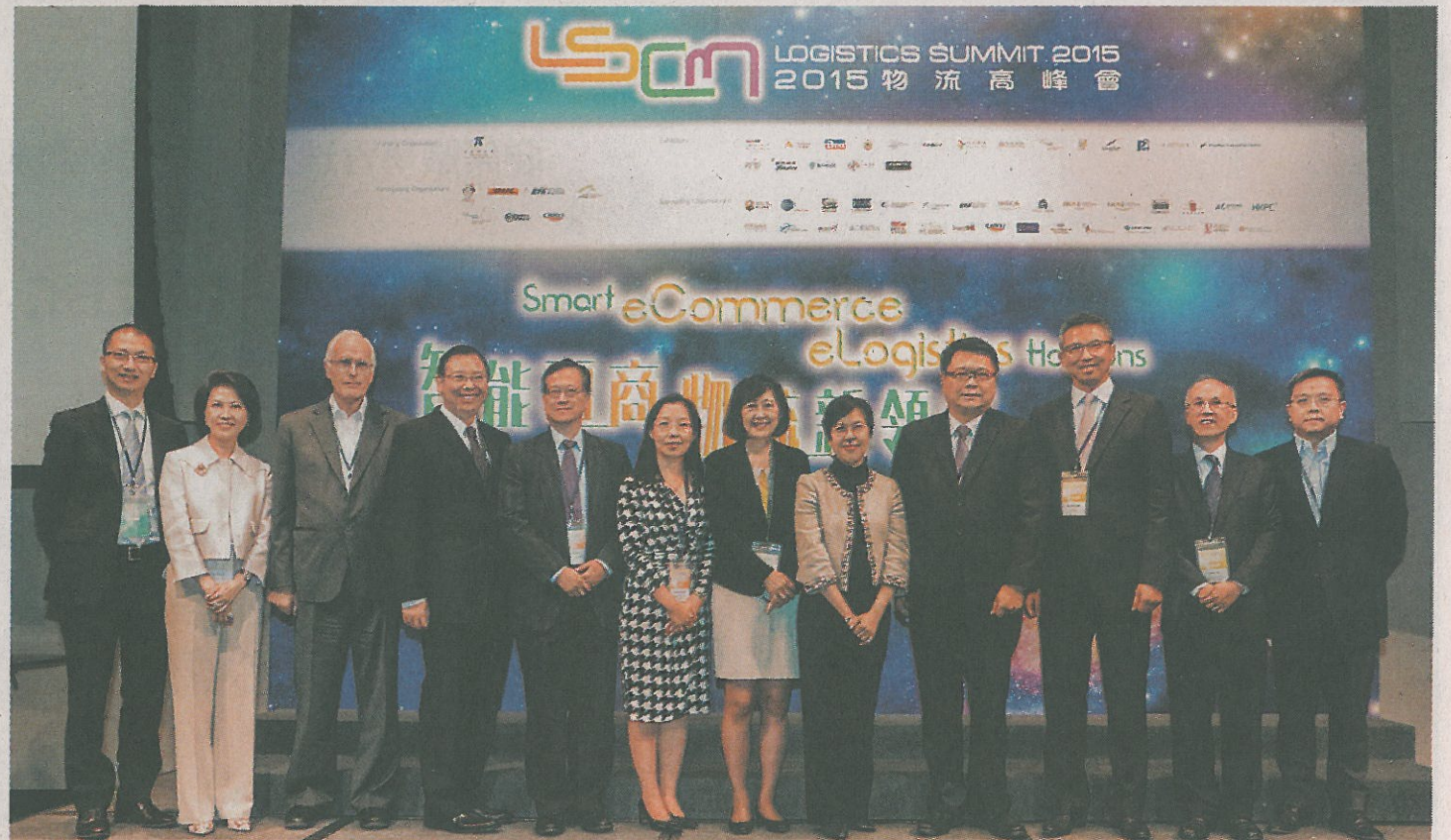
「2015 LSCM物流高峰會」匯聚物流及科技業界精英。