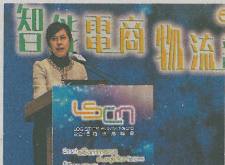
創新科技署署長蔡淑嫻與業界與特區政府及研究人員採用更多創新科技，推動有關業務在本港的發展。